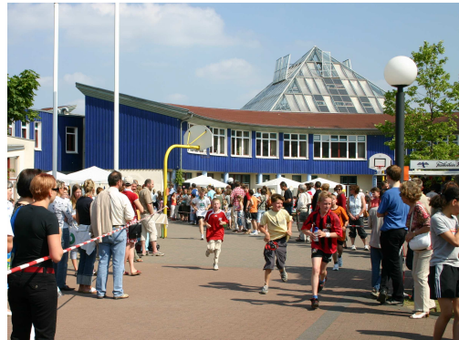
Sponsorenlauf um das Schulgebäude